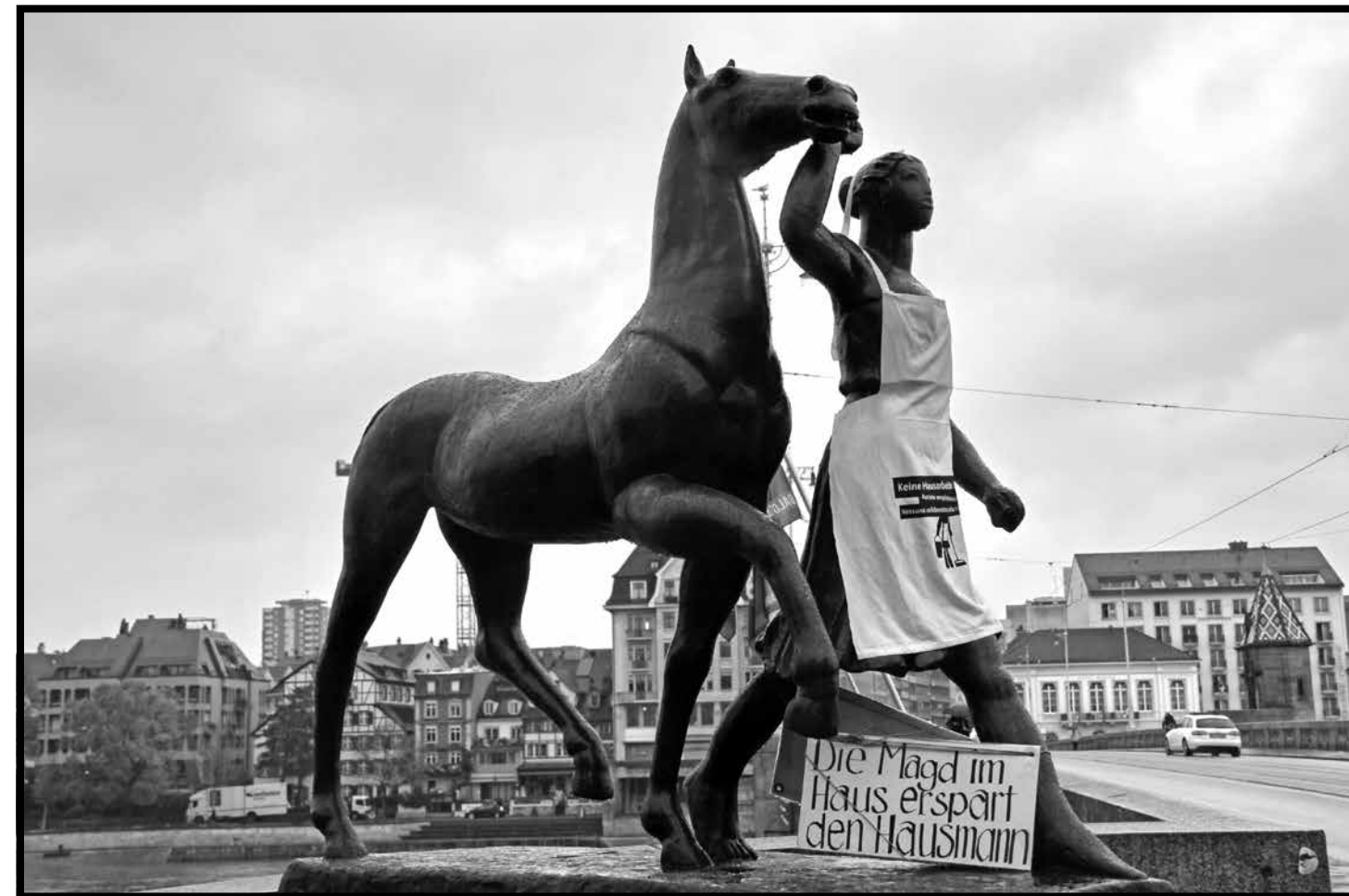
Eingekleidete Skulptur «Amazone mit Pferd» in Basel im Rahmen der Aktion «Keine Hausarbeiterin ist illegal»

Zwar leben Sans-Papiers ohne Aufenthaltsbewilligungen in der Schweiz, dies bedeutet jedoch nicht, dass ihnen keine Rechte zustehen. Unabhängig von ihrem Aufenthaltsstatus stehen Sans-Papiers die in den internationalen Konventionen und der Schweizerischen Bundesverfassung verankerten Menschen- beziehungsweise Grundrechte zu. So sind in der Bundesverfassung das Recht auf Bildung und das Recht auf Hilfe in Notlagen festgehalten. Sie gelten für alle sich in der Schweiz aufhaltenden Personen. Kindern steht damit der Besuch des obligatorischen Schulunterrichts zu, der Zugang zu weiterführenden Bildungsangeboten ist jedoch bereits stark erschwert. Auch im Bereich des Arbeitsrechts und der sozialen Rechte können Sans-Papiers gewisse Ansprüche geltend machen. So bleibt es ihnen zwar verwehrt, eine Arbeitsbewilligung zu erhalten. Gehen Sans-Papiers aber dennoch einer Erwerbstätigkeit nach, entstehen sowohl für sie als auch für ihre Arbeitgeber_innen durch dieses faktische Arbeitsverhältnis Rechte und Pflichten. Dazu gehören unter anderem «das Anrecht auf einen orts- und branchenüblichen Lohn, bezahlte Ferien und Lohnfortzahlungen bei Krankheit und Unfall» (Caroni, 2014). Weiter sind Krankenkassen verpflichtet, alle in der Schweiz wohnhaften Personen zu versichern.