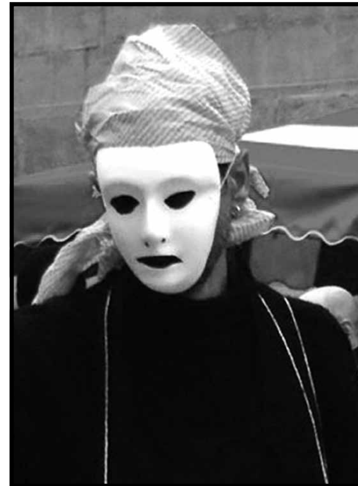
«Je ne demande pas la lune» Demonstration in Lausanne

von zentraler Bedeutung» (Efionayi-Mäder et. al., 2010). Diese Netzwerke beschränken sich oftmals nicht nur auf das persönliche Umfeld in der Schweiz, sondern umfassen auch die Beziehungen zu Familie sowie Freund_innen im Herkunftsland. Sans-Papiers Hausarbeiterinnen leben häufig in verschiedenen Welten und der Kontakt zu wichtigen Personen im Herkunftsland wird durch Kommunikation oder gar finanzielle Unterstützung weitergelebt. Im Zusammenhang mit Sans-Papiers Hausarbeiterinnen wird oft von einer «doppelten Unsichtbarkeit» gesprochen: Einerseits werden sie in der Gesellschaft kaum wahrgenommen, weil sie Arbeiten im «Privaten» ausführen. Gleichzeitig müssen sie selber unentdeckt leben, da ihr Aufenthalt in der Schweiz den Behörden nicht bekannt sein darf.