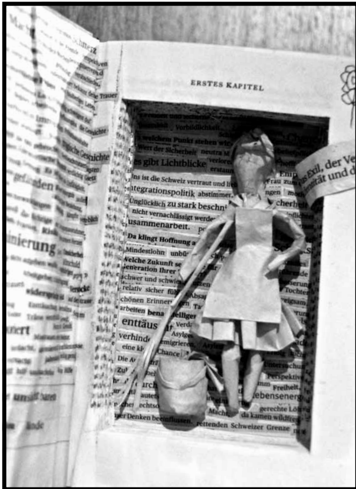
Ausstellungsexponat von Maja Graf – Geschichten füllen Bänder